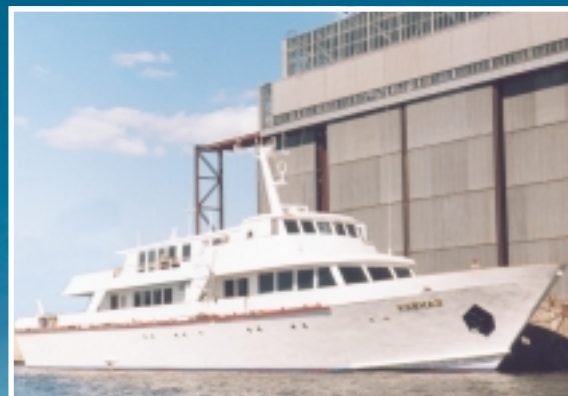
Представительская яхта Президента России «Кавказ»