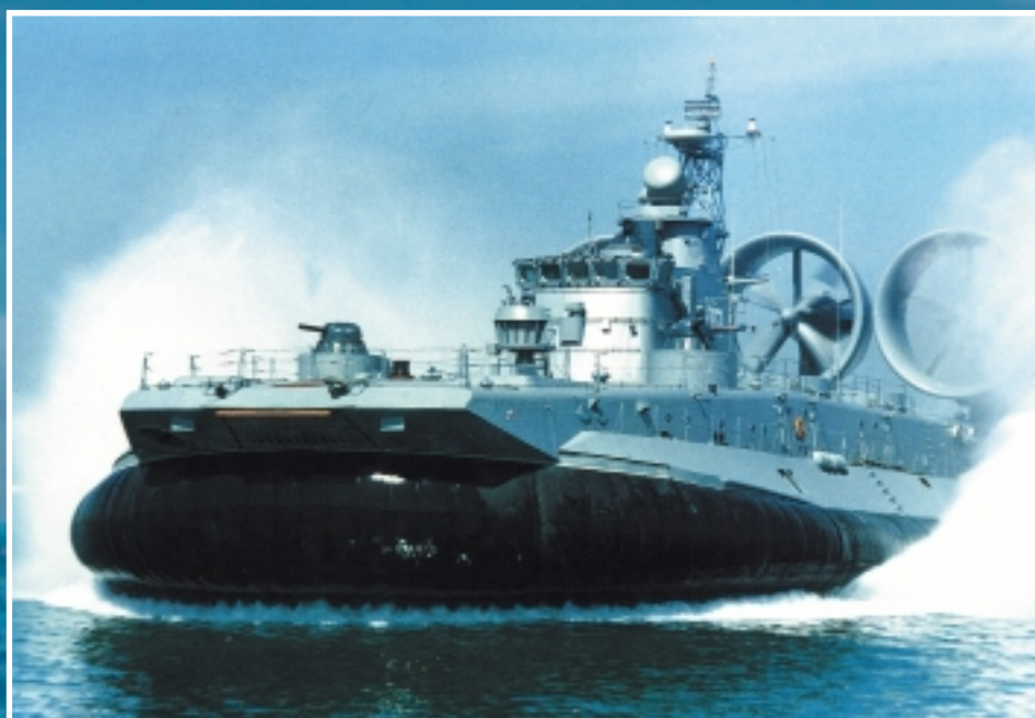
Десантный корабль на воздушной подушке проекта 12322 «Зубр»