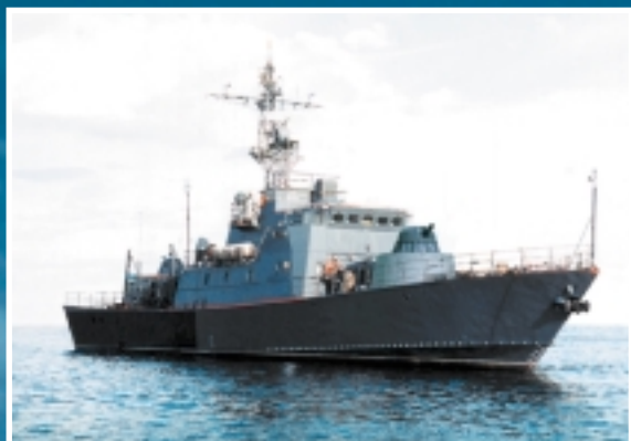
Сторожевой катер проекта 10412 «Светляк»