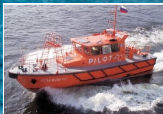
Лоцманское судно проекта AP-1600

Россия, 197110, С.-Петербург, Петровский пр., 26