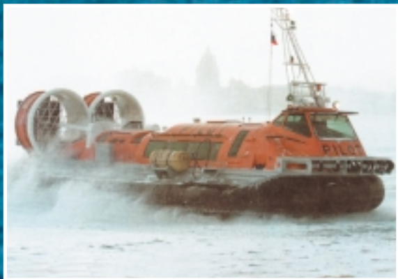
Многоцелевой катер на воздушной подушке «Рысь»