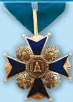
Орденский знак Санкт-Петербургского Морского собрания