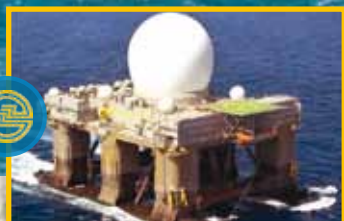
ФИЛИАЛ ВЫБОРГСКИЙ ВЫБОРГСКИЙ СУДОСТРОИТЕЛЬНЫЙ ЗАВОД