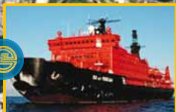
ФИЛИАЛ БАЛТИЙСКИЙ АЛМАЗ БАЛТИЙСКИЙ ЗАВОД