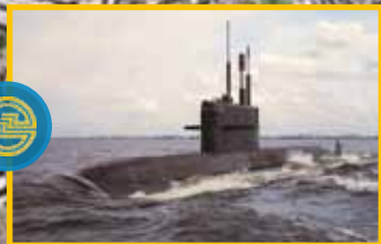
ФИЛИАЛ АДМИРАЛТЕЙСКИЙ АДМИРАЛТЕЙСКИЕ ВЕРФИ