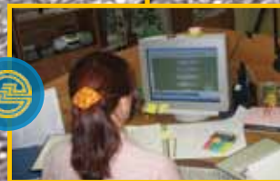
ПРОЕКТНО-КОНСТРУКТОРСКОЕ БЮРО «ЭРА-ПРОЕКТ»