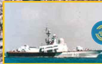
ФИЛИАЛ САПФИР СРЕДНЕ-НЕВСКИЙ ЗАВОД