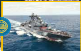
ФИЛИАЛ СЕВЕРНАЯ ЭРА СЕВЕРНАЯ ВЕРФЬ