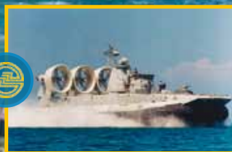
ФИЛИАЛ БАЛТИЙСКИЙ АЛМАЗ СФ «АЛМАЗ»