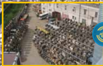
ПРОИЗВОДСТВЕННО- СКЛАДСКОЙ КОМПЛЕКС