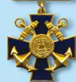
Орден «За заслуги в морской деятельности 1 степени»