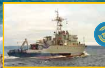
ФИЛИАЛ КОНТАКТ ЗАВОД «АВАНГАРД» г.ПЕТРОЗАВОДСК