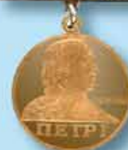
Золотая медаль «Петр I»