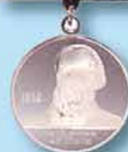
Серебряная медаль «А.Н. Крылов»